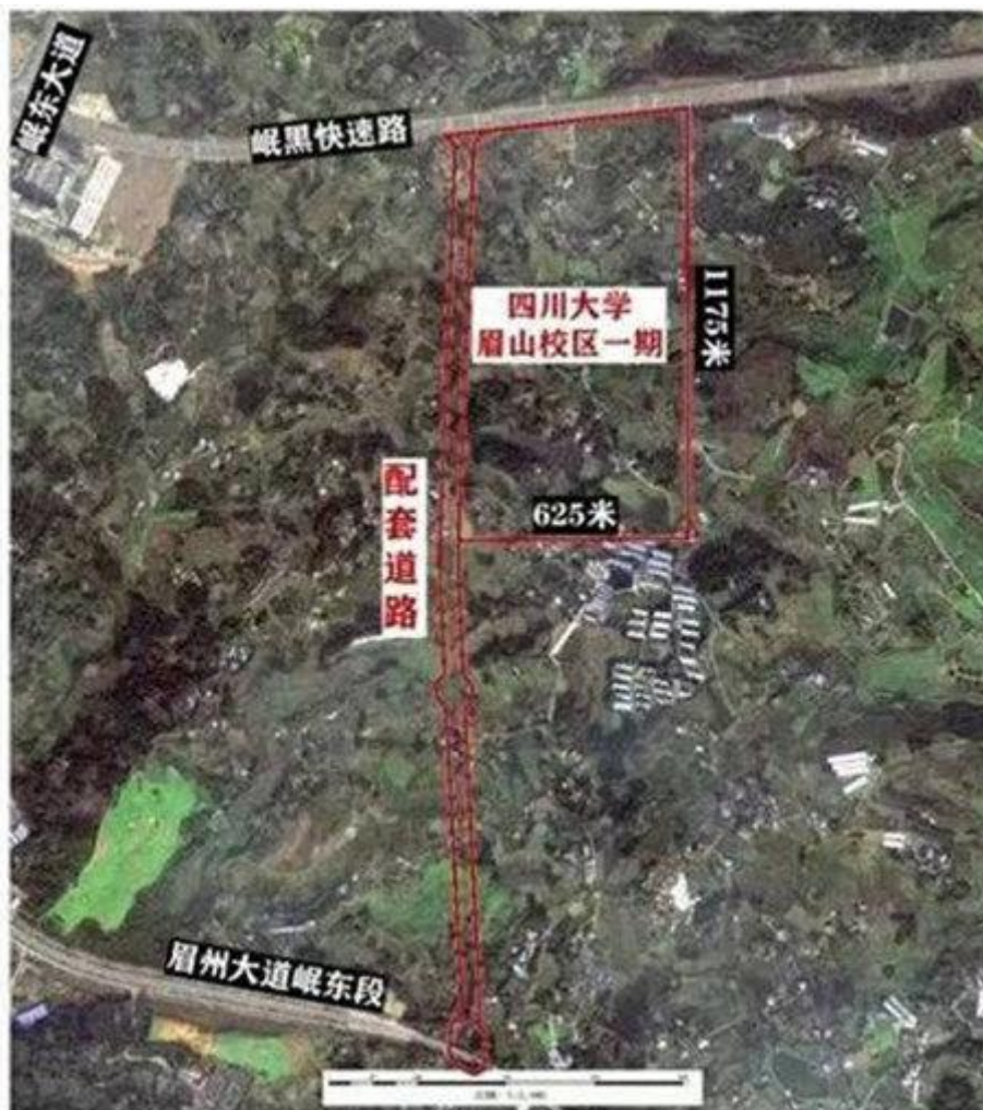
四川大学眉山校区一期及配套道路选址区域影像图

通过选址的地图来看，其近邻眉山市中医医院，两者配合之下，将为岷东提供更优质的公共配套服务，助力岷东健康养老、教育科研等新城的全面建设。